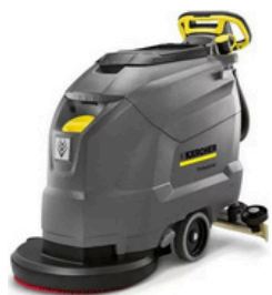
Lavadora industrial lava e seca

Itens necessários para a limpeza mecânica: